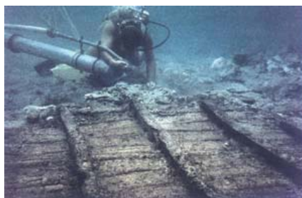
Podmorsko istraživanje liburnskoga šivanog broda

Budući da su obožavali zmiju, Liburni su gradili drakofores , brodove sa zmijskim glavama odnosno takvim pulenama iz kojih su kasnije vjerojatno nastali čuveni vikinški drakkari . Takvi su brodovi prikazani i na poznatoj steli iz 5. i 6. stoljeća p.n.e. iz talijanske Novillare.