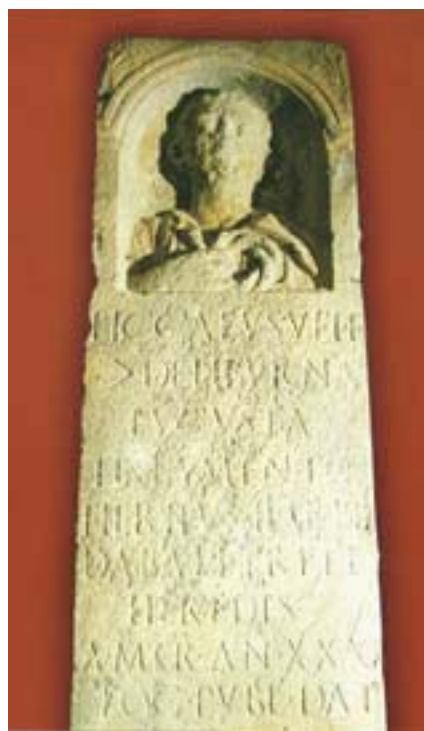
Nadgrobna ploča mornara Likeja s rimske liburne Lucusta pronađena na otoku Cresu

Poznato gledište da su muškarci kao kokoši, da nemaju mozga a da nose jaja, kao da opisuje jedan lik koji, u Komiži, svi nazivaju Matom-Bez-Mozga. Budući