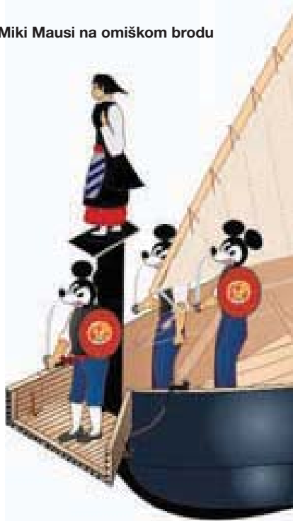
Miki Maudi na omiškom brodu

postaje globalno selo . Stoga ne bi imalo smisla suviše se opirati svekolikom prožimanju ljudskih kultura.