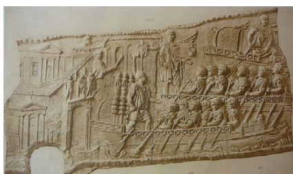
Reljef sa stupa imperatora Trajana s prikazom rimskih liburni