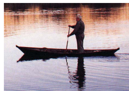
Veslanje stojeći u trupi na Baćinskim jezerima

No za to je potrebno poduzeti određeni napor u području obrazovanja.