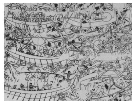
Bitka Egipćana s Narodima s mora prikazanih s perjanicama

Prema raznim nedvosmislenim pokazateljima uključujući jezik, zemljopis i gene, izgleda da su Liburni naselili otoke Siciliju i Sardiniju, te pokrajine Toskanu, Veneto i Piceno, a na sjevernom Jadranu, kamo su ih potisnuli ratoborni Delmati i Grci, naselili su istočnu obalu Jadrana između rijeka Raše u Istri i Krke kod Šibenika. Čini se da su Liburni nadasve voljeli stanovati na otocima. Otud vjerojatno potječe i Venecija.