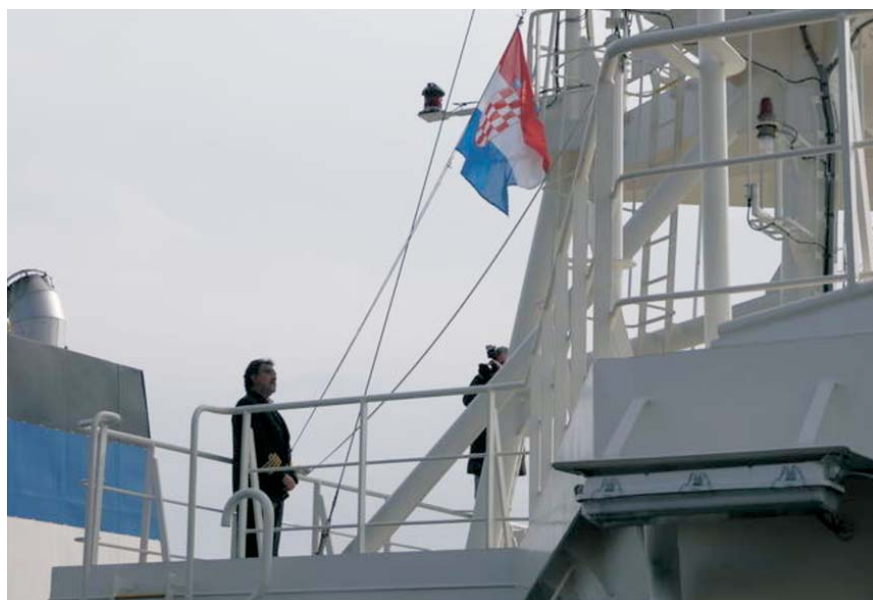
Pomer će ploviti pod hrvatskom zastavom

Brod je dugačak je 195 i širok 32 metra. Tanker 'Pomer', koji je u more porinut u srpnju 2010. godine, građen je pod nadzorom klasifikacijskih društava Det Norske Veritas i Hrvatskog registra brodova , a plovit će pod hrvatskom zastavom.