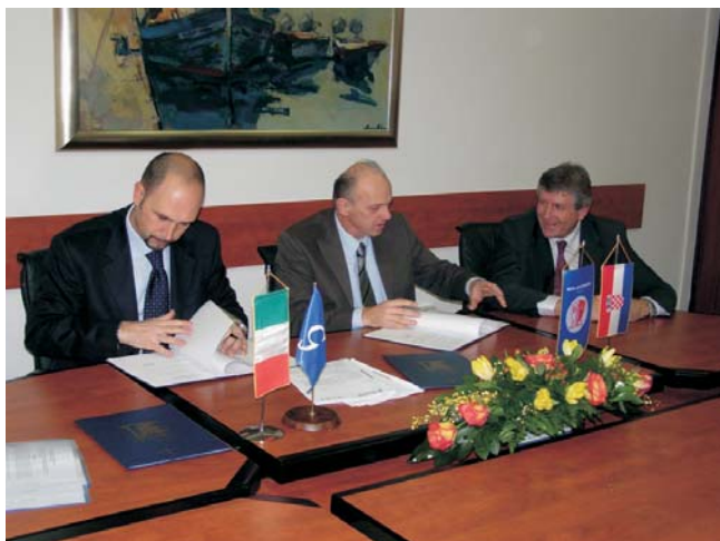
Grande Togo – potpisivanje primopredajnih dokumenata