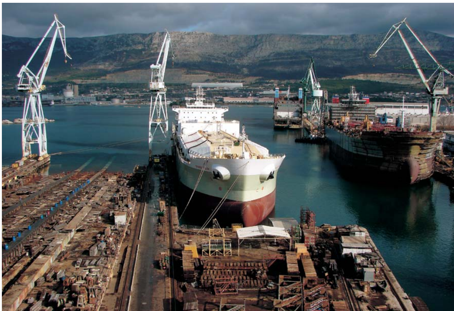
M/v Orange Star, najveći do sad izgrađeni orange juice carrier